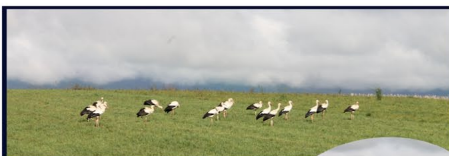
Et bien en voilà des jolies cigognes !

Félicitations aux parents Yves & Lucie Sauthier