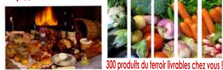
300 produits du terroir livrables chez vous !