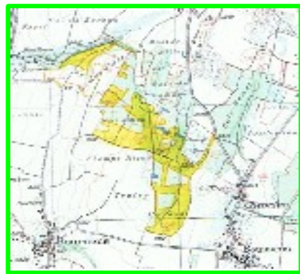
Notre patrimoine forestier

C'est une généralité dit-il : « le manque d'intérêt d'une majorité de propriétaires privés à mieux connaître et entretenir leur forêt » et « l'évolution de la profession nous éloigne de plus en plus du terrain au profit de plus de travaux administratifs ».